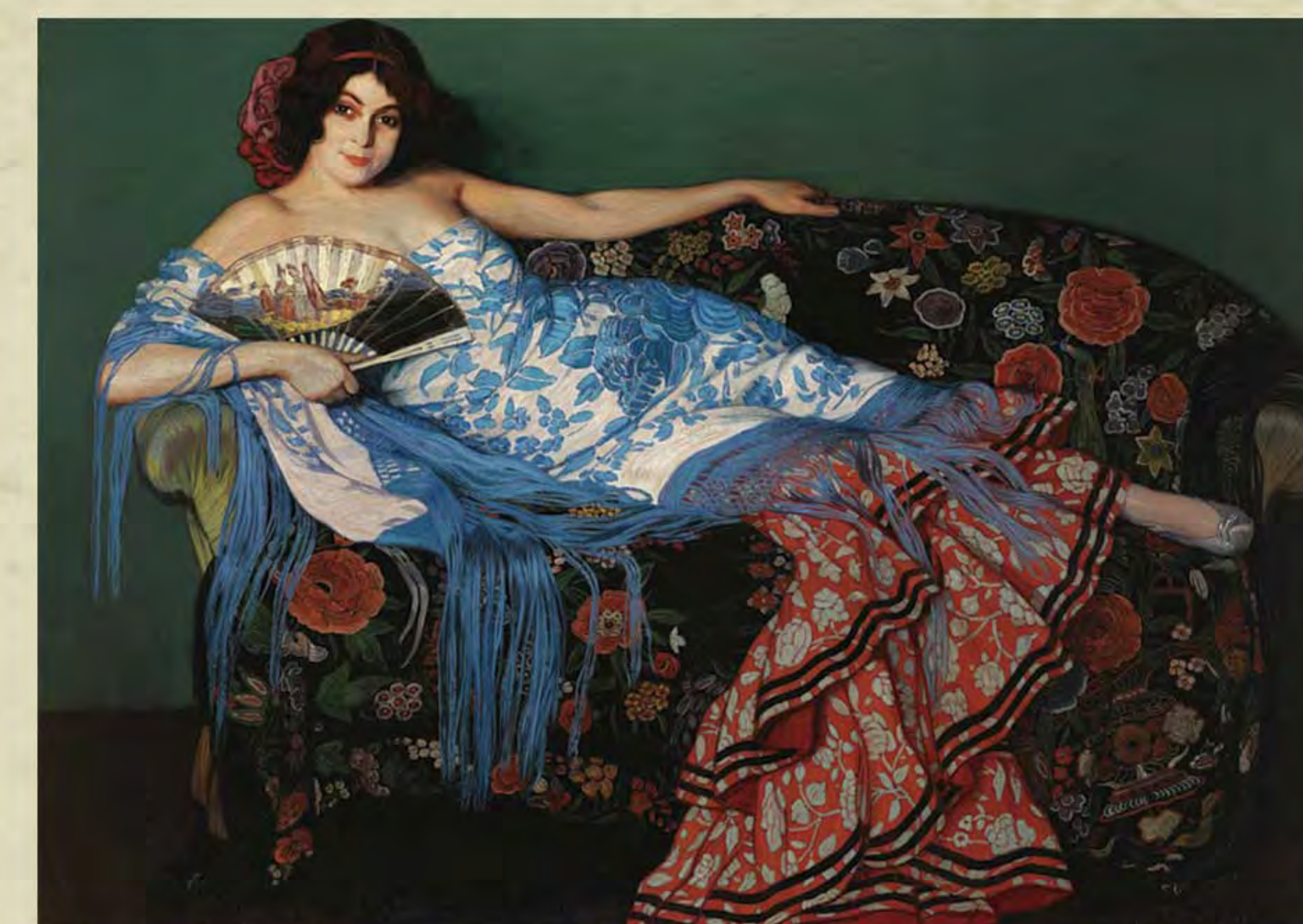
Lolita tendida. Ignacio Zuloaga. Museo Ignacio Zuloaga. Castillo de Pedraza.

MUSEO ART NOUVEAU Y ART DÉCO CASA LIS 2 DE MARZO - 5 DE JUNIO