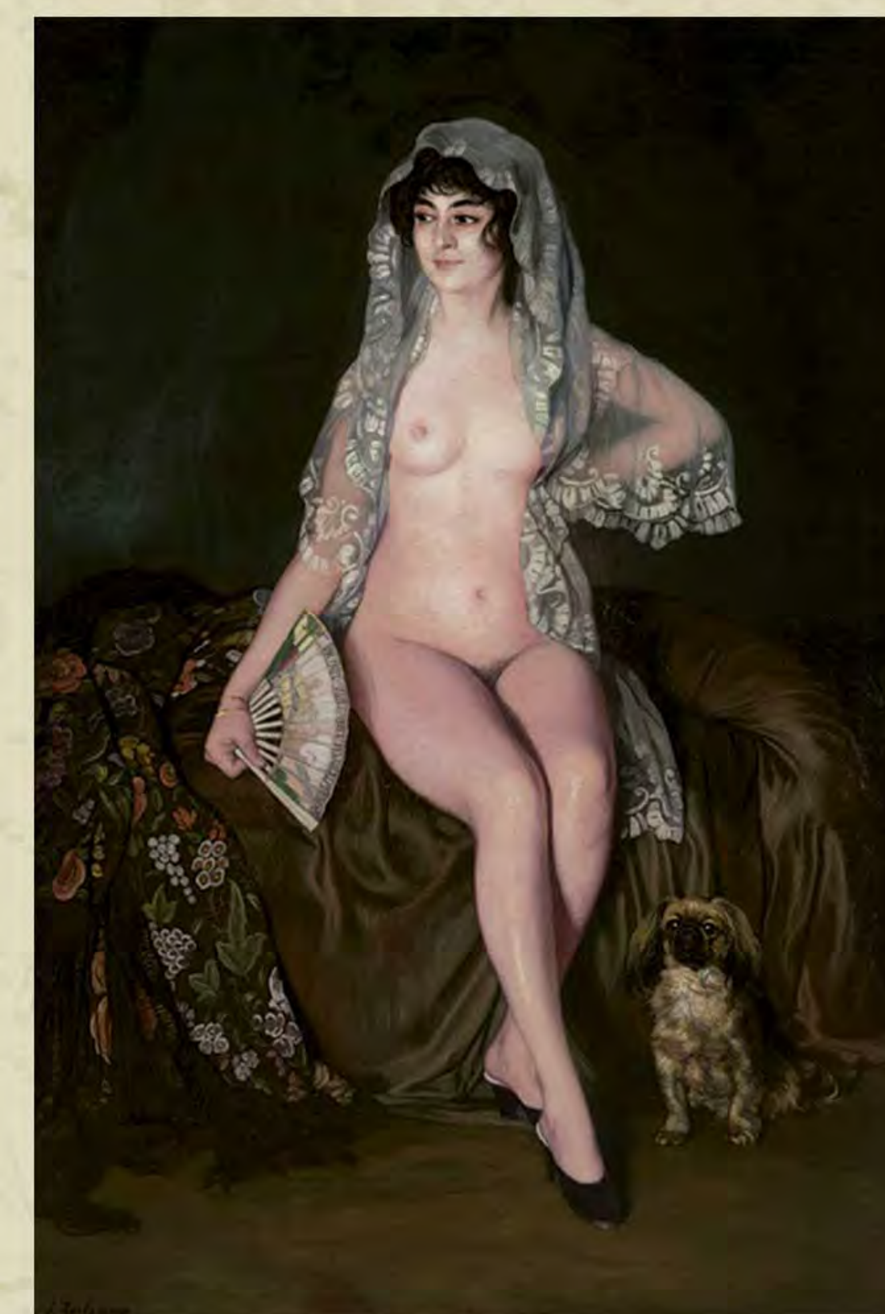
Desnudo del Pekinés . Ignacio Zuloaga. Museo Ignacio Zuloaga. Castillo de Pedraza.

Tras este intenso 1922, habrá que esperar seis años para verlos reunidos una vez más. Mientras Zuloaga está triunfando en América, Falla estrena una obra cumbre en su corpus, El retablo de Maese Pedro , pieza fundamental de la historia de la música española basada en el inmortal Quijote de Cervantes .