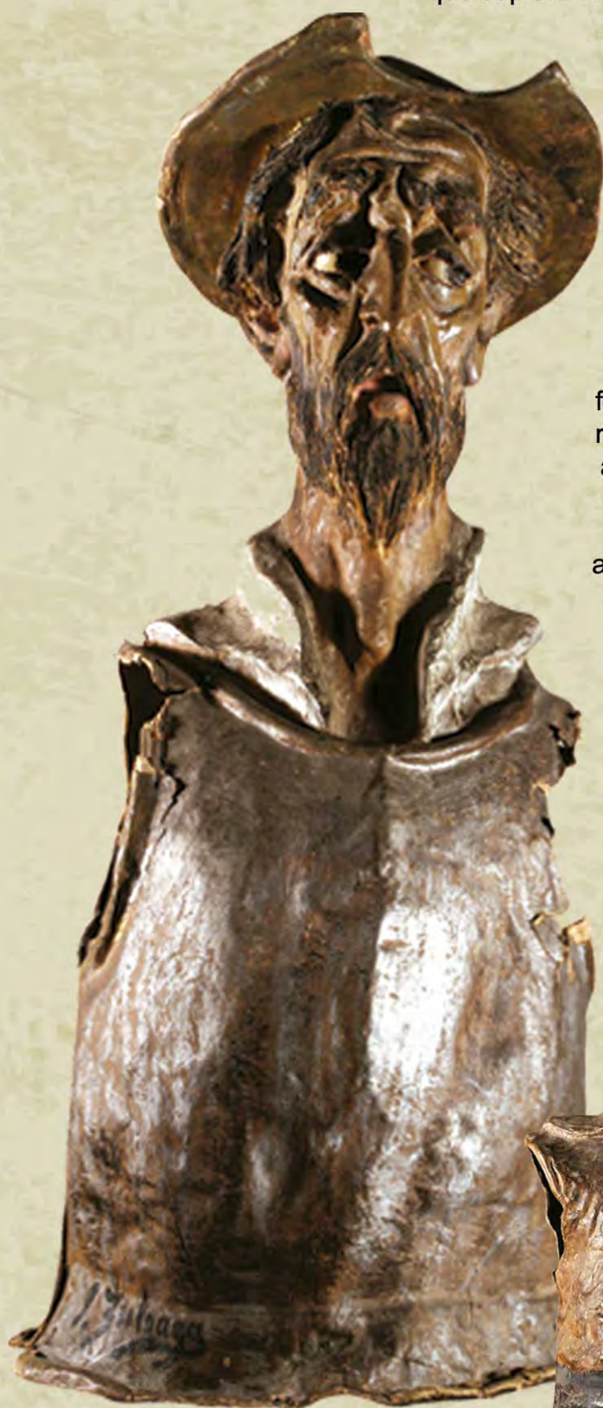
Cabezudos del retablo de Maese Pedro. Museo Ignacio Zuloaga. Castillo de Pedraza.

relación amistosa, casi familiar, al tiempo que se ilusionaban con la creación de proyectos artísticos comunes, proyectos filantrópicos y proyectos culturales en general. Todo ello forjado por una profunda reflexión conceptual que arraiga en el proyecto regeneracionista que se forjó, durante esos años, en la España que luchaba por abandonar el pesimismo noventa-yochista en pos de una España de gran potencia cultural basada en sus tradiciones y aciertos pasados, proyectándola a un futuro internacional.