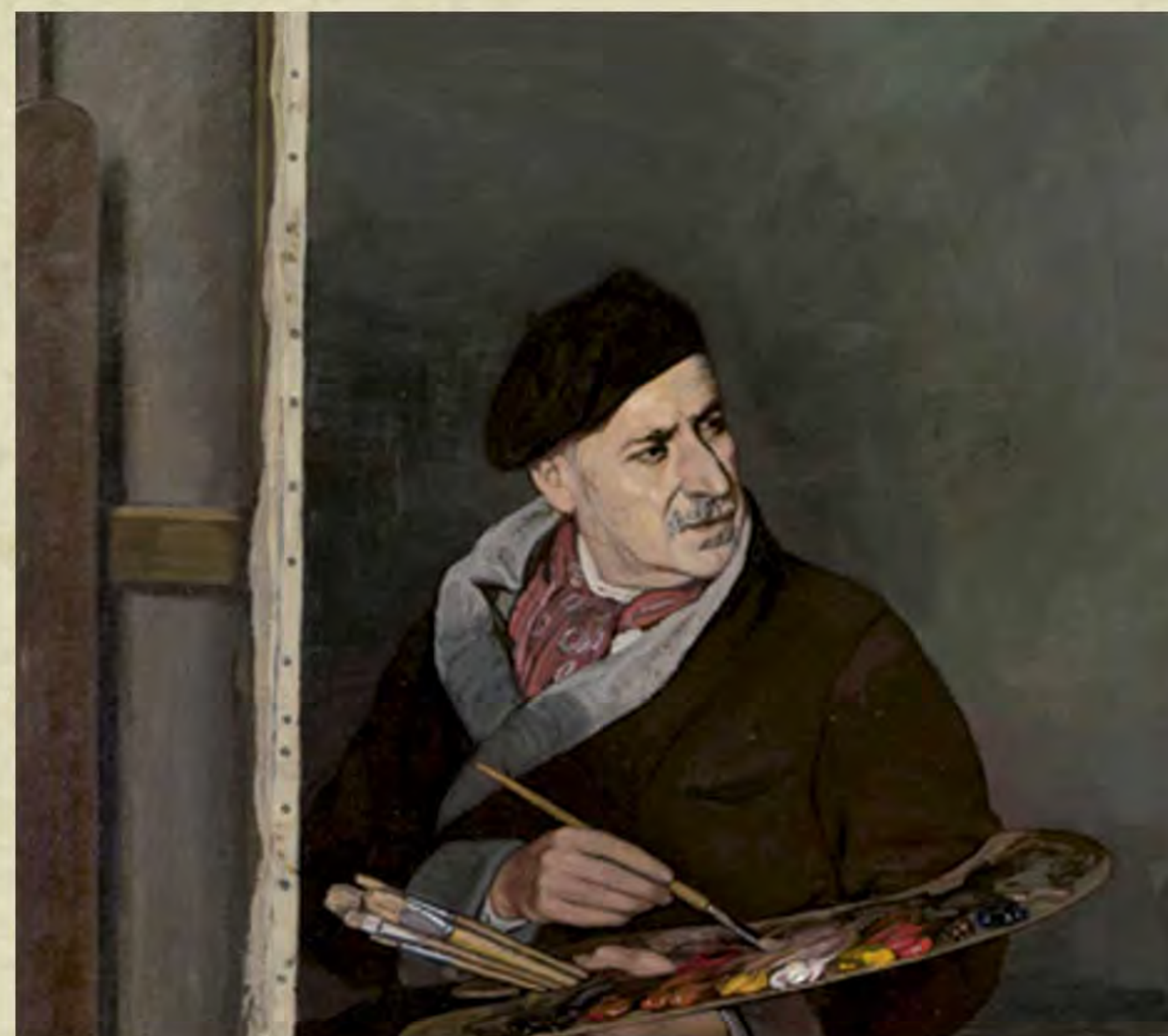
Autorretrato de Zuloaga en La familia del pintor . (detalle). Ignacio Zuloaga. Museo Zuloaga. Castillo de Pedraza.

La exposición se articula en una serie de hitos fundamentales de esta relación –que hoy conocemos gracias al rico epistolario que nos han legado– que dejan un rastro cronológico de aquellos cuestiones comunes que hicieron posible el crecimiento personal y artístico de ambos.